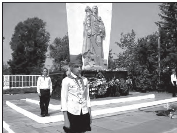
Тяжинский побратим берлинского монумента в Трептов-парке

Пройдут годы, а монумент воину-освободителю по-прежнему будет стоять в Трептов-парке, обращённый лицом на Запад, с мечом, разрубающим свастику, и немецкой девочкой на руках. Будто напоминание: «Кто с мечом к нам придёт – от меча и погибнет» и ещё о том, что русские солдаты с детьми не воюют.