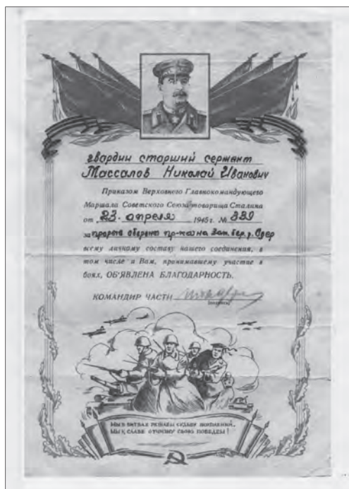
Благодарность Верховного Главнокомандующего