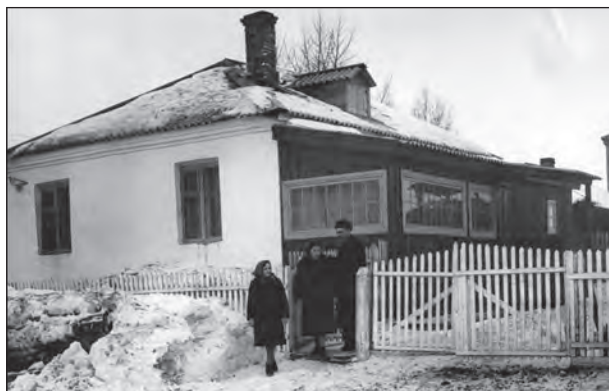
Дом семьи Масаловых в посёлке Тяжинском

Николай Иванович Масалов родился 10 декабря 1922 года в селе Вознесенка Тисульского района Кемеровской области. Он появился на свет в семье выходцев из Курской губернии, переселившихся в Сибирь в поисках лучшей доли. Прадед, дед и отец Николая Масалова были потомственными кузнецами, мастерство которых высоко ценилось по всей округе. В крестьянской семье Маса-