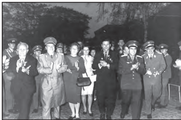
Поездка в Берлин, 1967 год