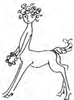
Рисунок Наги Ручевой