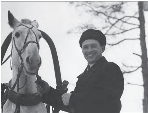
Солдатское счастье – жить за себя и за того парня

Воинам-гвардейцам армии генерала Чуйкова предстояло сразиться с отборными нацистами –