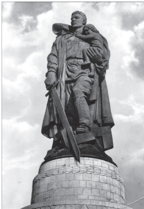
Памятник советскому воину-освободителю в Трептов-парке

– Автор был контужен, но не лишён языка, – отрывисто бросил Сталин и посмотрел на вторую фигуру. – А это что?